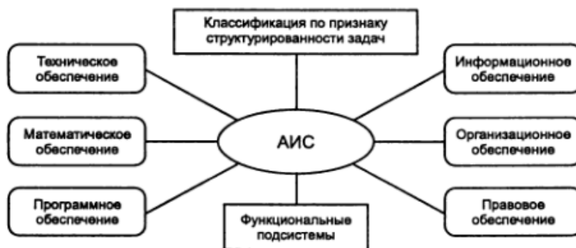
Рис. 1.1. Структурная схема терминов АИС

1. Информационное обеспечение (ИО) — совокупность единой системы классификации и кодирования информации, унифицированных систем документации, схем информационных потоков, циркулирующих в организации, а также методология построения баз данных.